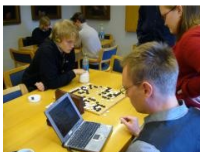
Kuva 8 (kirjaus1.jpg): Turnauspelejä kirjataan joskus tietokoneelle.