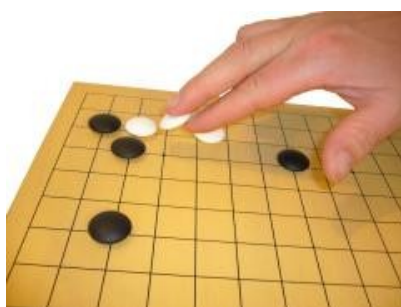
Kuva 5 (kasi1.jpg): Kiven laittaminen laudalle