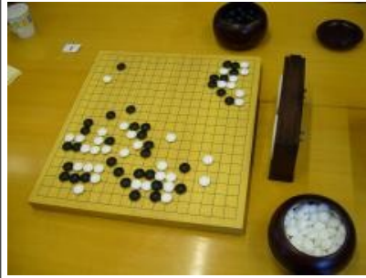
Kuva 11 (peli01.jpg): Käynnissä oleva turnauspeli.