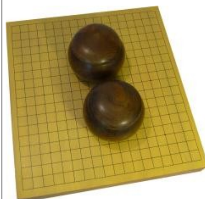
Kuva 6 (lauta2.jpg): Lauta ja kivikupit