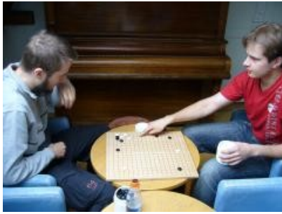
Kuva 10 (lapikaynti01.jpg): Peliä analysoidaan pelin jälkeen.