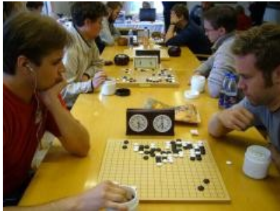
Kuva 13 (turnauspeleja01.jpg): Turnauspelejä käynnissä.