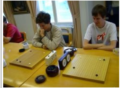
Kuva 12 (pelinaloitus01.jpg): Kaksi turnauspeliä pelin alkupuolella.