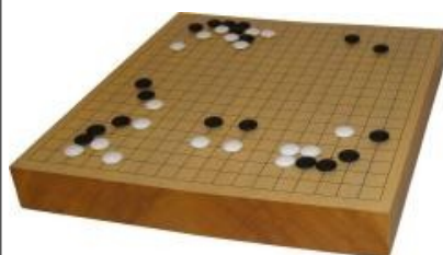
Kuva 4 (lauta1.jpg): Peli alkuvaiheessaan