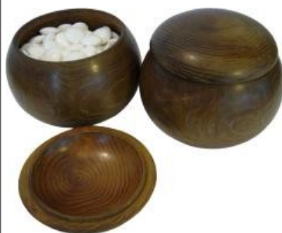
Kuva 7 (kupit1.jpg): Perinteiset kivikupit