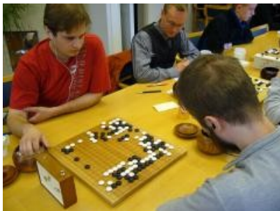
Kuva 16 (turnauspeleja04.jpg): Turnauspelejä käynnissä.