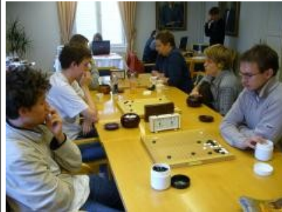
Kuva 14 (turnauspeleja02.jpg): Turnauspelejä käynnissä.