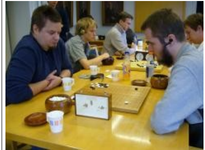
Kuva 15 (turnauspeleja03.jpg): Turnauspelejä käynnissä.