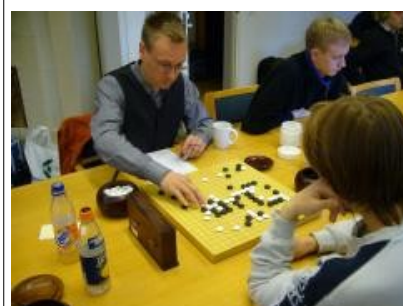
Kuva 9 (laittopelissa01.jpg): Valkea pelaaja pelaa laitton.